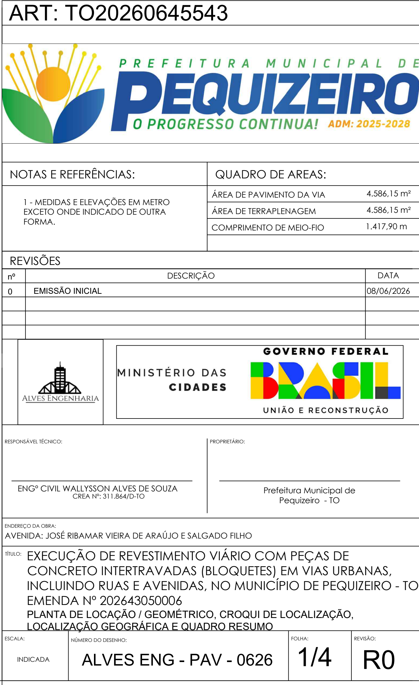
LOCALIZAÇÃO GEOGRÁFICA ESCALA S/E